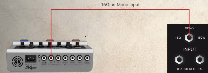
AMP1 | Gitarrenverstärker mit 16Ω-Ausgang

Wenn die MONO INPUT Buchse belegt ist, sind beide Lautsprecher aktiv. Dann liefert die TWINCAB™ 150 Watt und hat eine Impedanz von 16 Ohm . Bitte achte darauf, dass der 16-Ohm-Lautsprecherausgang deines Verstärkers über ein Speakerkabel nur mit dem MONO INPUT deines BluGuitar® TWINCAB™ verbunden ist. Die beiden anderen Anschlussbuchsen der TWINCAB™ dürfen dann nicht genutzt werden.